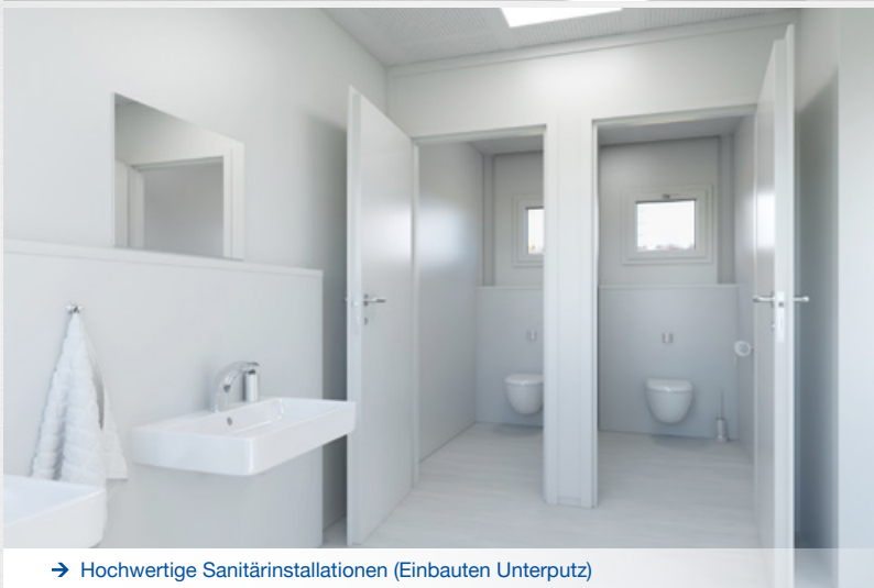
→ Hochwertige Sanitärinstallationen (Einbauten Unterputz)