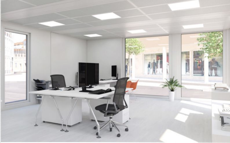
→ Helle Räume dank Vollverglasung