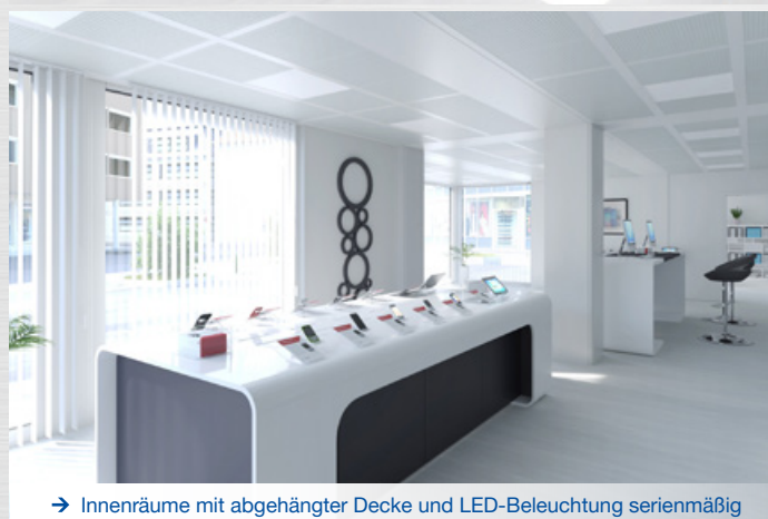
→ Innenräume mit abgehängter Decke und LED-Beleuchtung serienmäßig