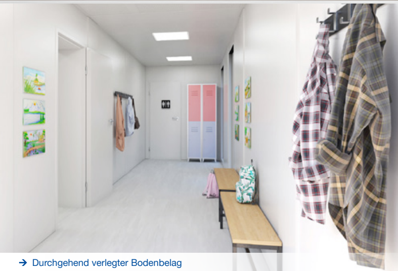
→ Durchgehend verlegter Bodenbelag